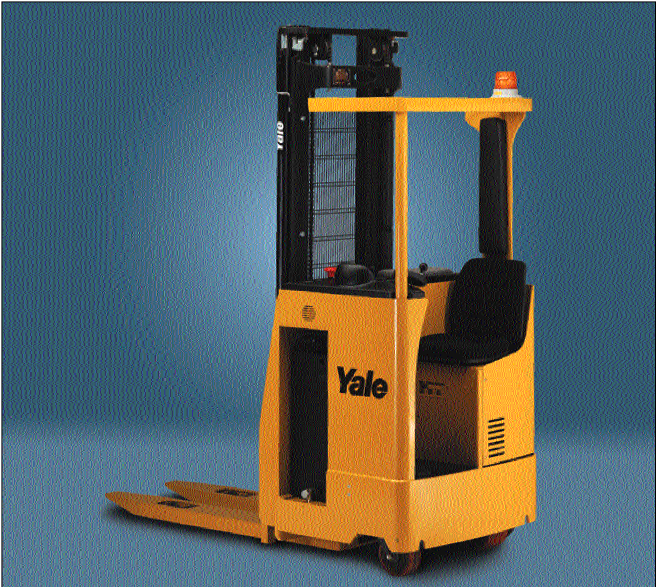
Der abgebildete Hochhubwagen enthält Sonderausstattungen.